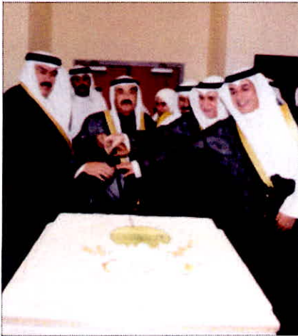
• سمو الشيخ ناصر المحمد مشاركاً في قطع كعكة الاحتفال