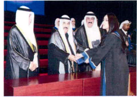
سمو الشيخ ناصر المحمد يكرم احدى الخريجات

المضيف : مخرجات الهيئة ماهرة وستعدل خريطة الأيدي العاملة في الكويت العميري : نفذنا 30 برنامجا و170 دورة لموظفي الأجهزة الحكومية