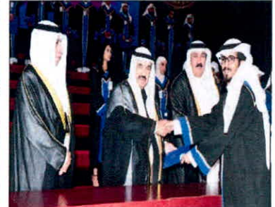
سمو الشيخ ناصر المحمد بن عبد الرحمن آل ثاني