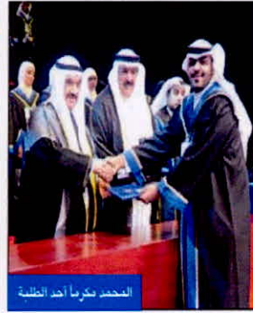
المحمد يكرم ما أخذ التلمذة