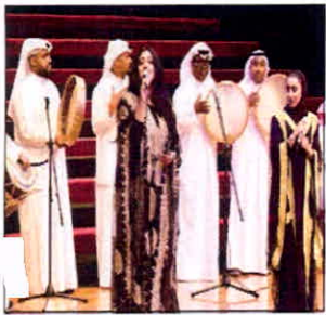
شعبة قسم المرسيني بزيون إحدى الفترات الفنية

لما بذله من جهد في الحصول على شهادة ضمان الجودة والاعتماد الأكاديمي من كلياته الشراعية، وتبعته الشراعية من مساندة الأفاضل الذين غمرونا بفيض عنايتهم واحترامهم بفتح أمانهم وكلنا أمل في أن نرد جزءا من جميل وطننا الذي أعطانا بلا حدود ووقر لنا سبيل العلم حتى نسهم في تنميته، ونشارك في نهضته وسيرتها المباركة في ظل قيادة صاحب السمو الأمير.