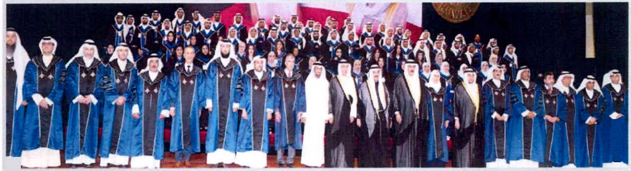
سمو الشيخ ناصر المحمد وزير التربية ووزير التعليم العالي خالد الغازي يتوسطان قياديي الهيئة والتدريب