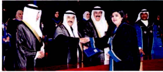
المحمد شكرها خريجة وبجانبه العارضين والمضف

ونماية عن زملائها الخريجين، قائلة الخريجة فرح لتجار إن الدراسة في الهيئة تمثل محطة من أغنى محطات الحياة وتقفه تحول لكل واحد منّا، أكسبته الكثير من المهارات والعارف التي جعلته متميزاً في تخصصه، بما بذله من جهد واجتهاد في تحصيل العلوم التطبيقية في الفصول والورش، والمختبرات