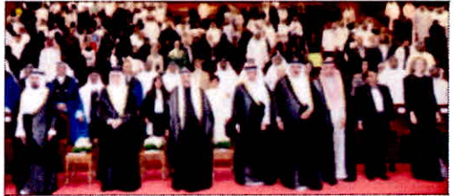
• سمو الشيخ ناصر المحمد والشيخ علي الجابر وزير التربية والمضف خلال عزف السلام الوطني

الثانية انه يجسد الأيدي الكويتية الماهرة التي ستدخل بالن الله واصفان أن المتربين الآن هم من أبناء قطاع التدريب ويستكملون قوة جديدة من الأيدي الفنية وتم تعليمهم في مختبرات العمل لدينا وتدريبهم في سوق العمل الكويتية لذلك نستطيع أن نعطي وعلم وتعلمي نوعي ونختلف الخبرات الفنية والانتشاء خلال الاجيال القادمة. وأشار المضف أن الشئس حين يشعرون تراب الوطن لا يحسون فيه عظمة الحضارة بل يجدون فيه روح الأمل والقدرة والبر وقوة السمراء ونشاط الشاربخ وشك المسحاني الكبرى.