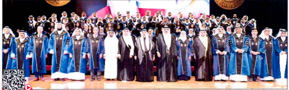
سمو الشيخ ناصر المحمد بن عبد الرحمن آل ثاني

ناصر المحمد بن عبد الرحمن آل ثاني يشهد حفل تكريم 90 طالبا وطالبة من المتفوقين في الهيئة للعام 2017-2018