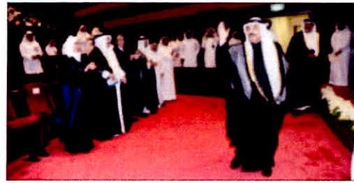
• سمو الشيخ ناصر المحمد محيياً الضور لدى وصوله لاحتفال