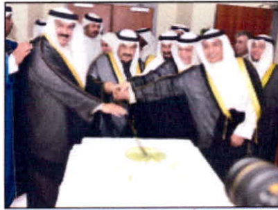
قطع قلب العنلة احتفالاً بتفريج التفرغين