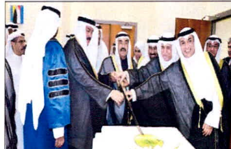
سمو الشيخ ناصر المحمد بن عبد الرحمن آل ثاني ومخاضم العازمي ومخاضم المسلف خلال فتح كنبة الاحتفال