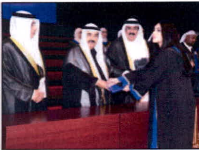
تكريم إحدى التفرغيات