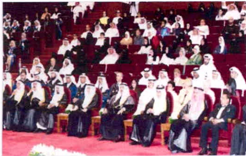
نائب من الحضور

المضيف : مخرجات الهيئة ماهرة وستعدل خريطة الأيدي العاملة في الكويت العميري : نفذنا 30 برنامجا و170 دورة لموظفي الأجهزة الحكومية