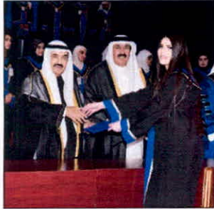
سمو الشيخ ناصر المحمد بن عبد الرحمن آل ثاني